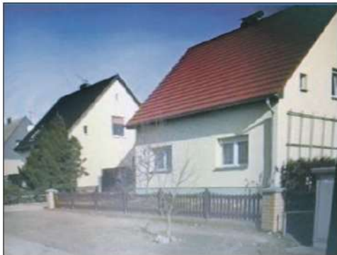
Lychener Straße 22

Bis zur 1. Scheidung (heute Parisiusstraße) zog sich Ackerland. Die anschließende Scheunenreihe wurde ebenfalls durch einige Fuhrwege unterbrochen. Dahinter, wie auch auf dem Kartenausschnitt ersichtlich, befand sich ein zweistöckiges Wohnhaus.