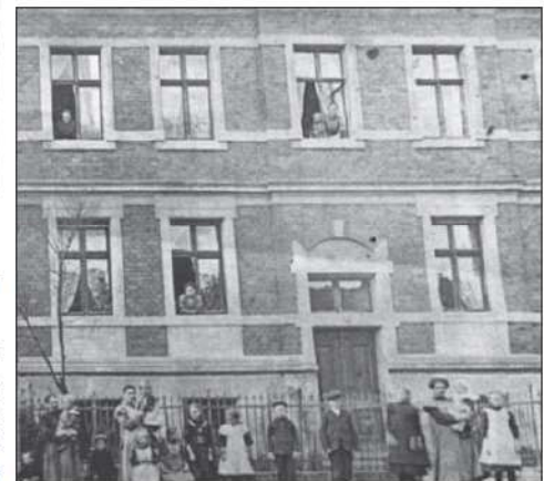
Lychener Straße 1

Davor zogen sich die Scheunen, unterbrochen von Durchfahrtswegen, bis zur heutigen Sparkassenfiliale. Einen kleinen Hang zwischen dem Scheunenviertel und dem Haus Nr. 1, nutzten die Kinder im Winter als Rodelberg. Das Haus Nr. 1 wurde 1912 von der Familie Schadow gebaut.