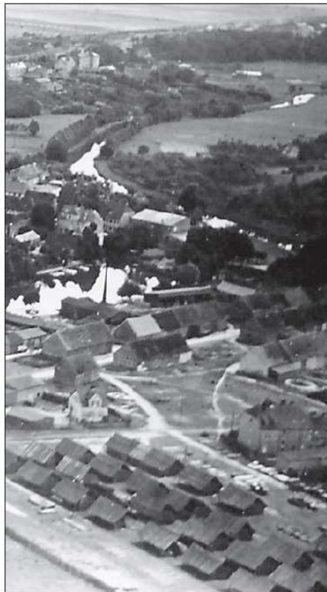
Scheunen in Knehdener Straße 1935

1954 brannte eine weitere Scheune in der Knehdener Straße durch Blitzeinschlag ab.