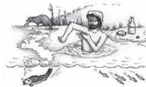
Körperpflege ohne Chemie

Feuer nur an ausgewiesenen Plätzen und ohne Waldbrandgefahrstufe, Informationen unter: www.dwd.de/waldbrand