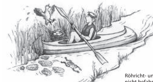
Röhricht- und Gelegegürtel nicht befahren