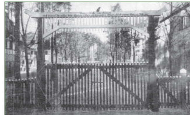
1908-Eingang zum Erholungsheim