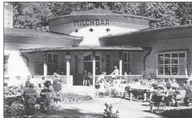
Die legendären Milchbar, wo nicht nur der Kuchen und das Eis begehrt waren.

Geschichte sehr deutlich wider. So gibt es zahlreiche Templiner, die auf Grund von Kriegsfolgen kurzzeitig oder länger in diesem Stadtteil lebten - Opfer des Bombenangriffs auf Templin am 6. März 1944, Flüchtlinge aus den ehemals deutschen Gebieten im Osten und viele andere. Man zog ein, zog bald wieder aus. Ganze Generationen blieben durch Verwandte oder Bekannte mit dem Postheim verbunden, waren oder sind noch heute „Postheimer“, ein von den Bewohnern geprägter Ausdruck der Verbundenheit mit ihrem Stadtteil. Die Stadt Templin tat sich unter den Mitbewerbern zum Bau des Erholungsheimes hervor und verkaufte 1906 und 1908 der zum Bau der Anlage gegründeten